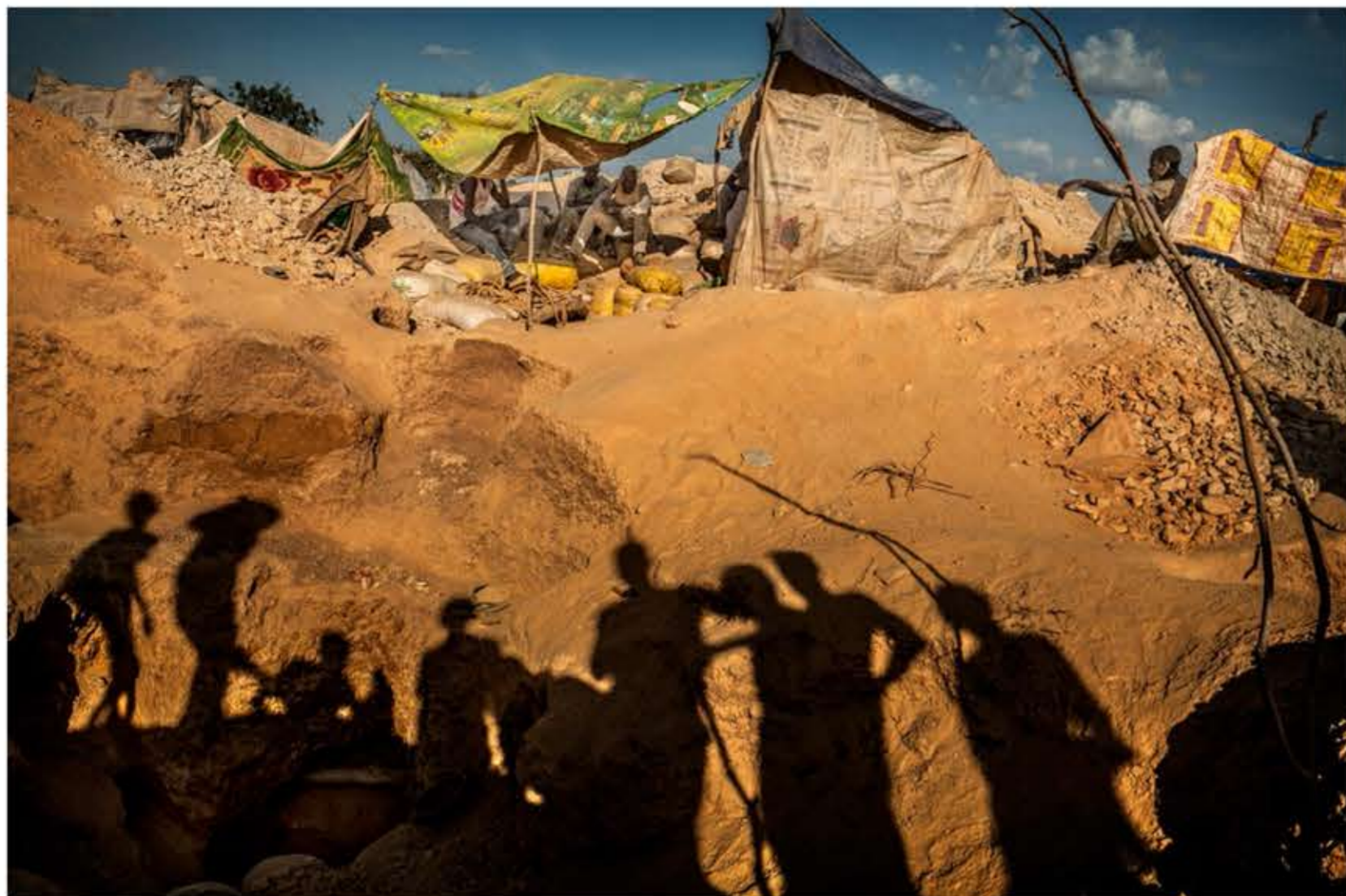
La sombra de uno de los muchos grupos de jóvenes que trabajan en la mina de oro artesanal Bousse.