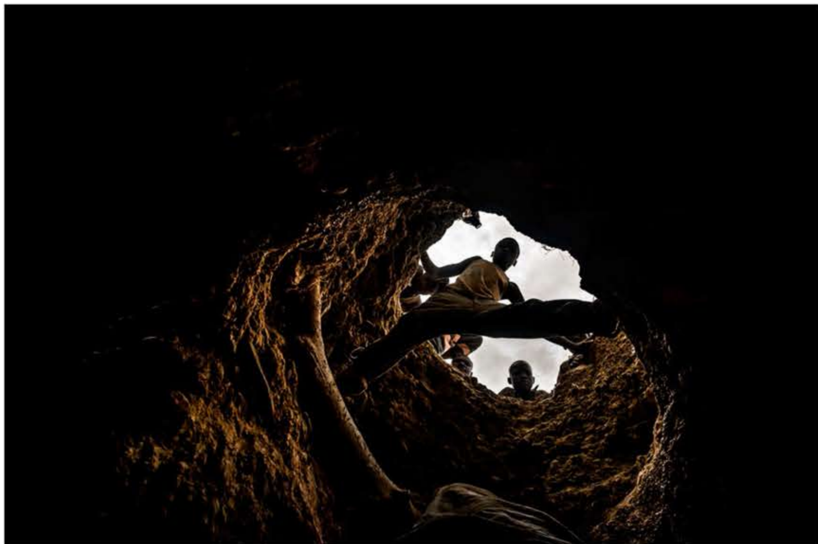
Un grupo de niños sale de las profundidades de su "agujero" tras otra larga jornada laboral en Mankarga V3, en una de las muchas minas de oro artesanales que hay diseminadas por toda la Sabana.