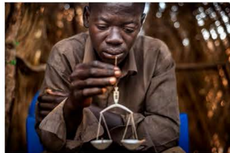
Un joven minero pesa los granos de oro obtenidos, antes de venderlos a un intermediario, en una mina de oro artesanal en Bousse.