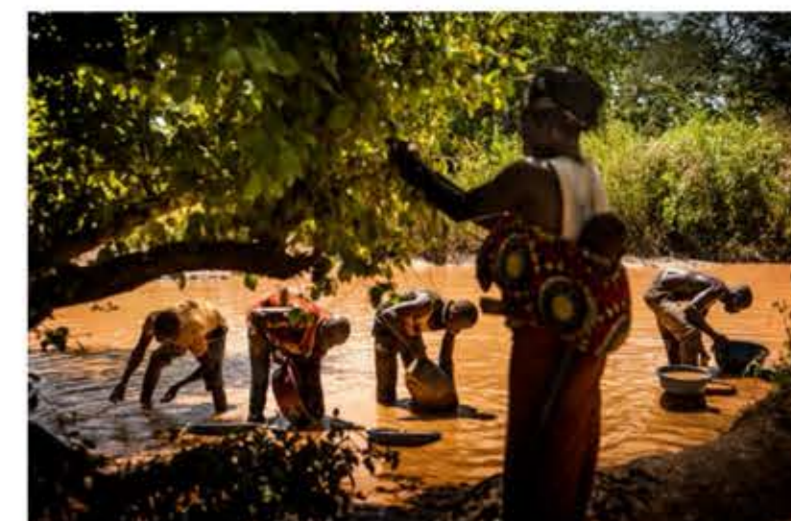
Un grupo de jóvenes lava la tierra que han extraído de las profundidades de la mina de oro artesanal de Yaika, en un riachuelo cercano y muy contaminado por el uso indiscriminado de mercurio.