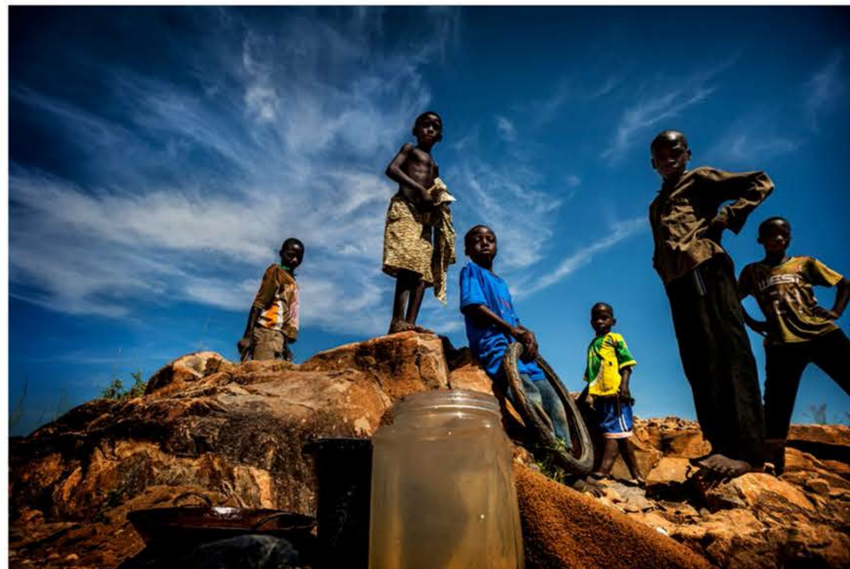
Un grupo de niños juega en la mina de oro artesanal de Mankarga V3.