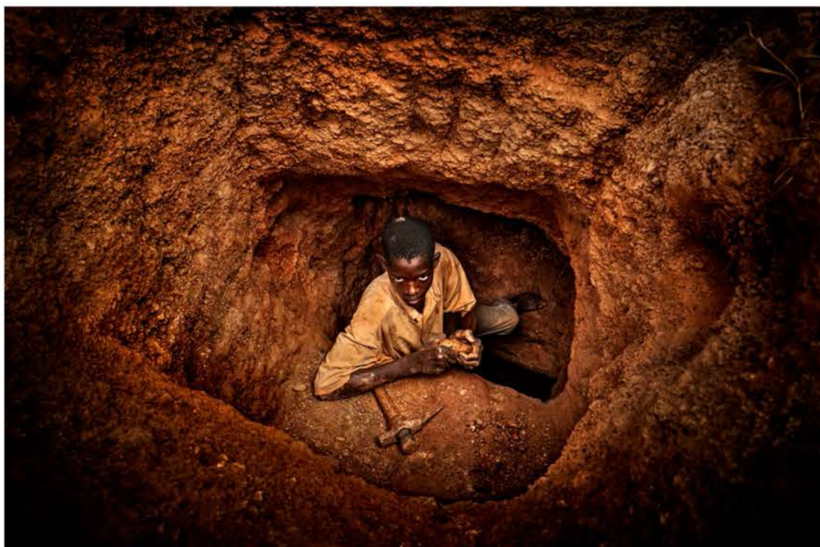
Un niño busca pepitas de oro incrustadas en una piedra que acaba de extraer de las profundidades en la mina de oro artesanal de Yaika.