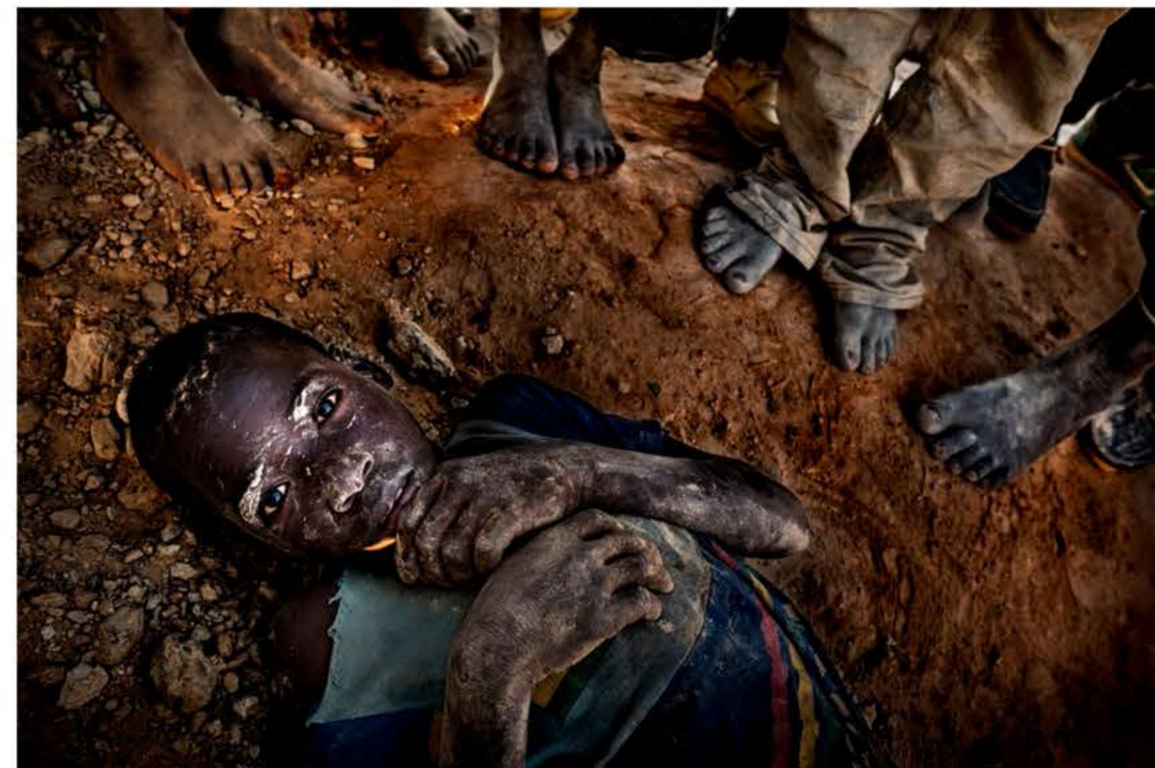
Un niño se toma un descanso durante una de sus maratónicas jornadas de trabajo en la mina de oro artesanal de Yaika.