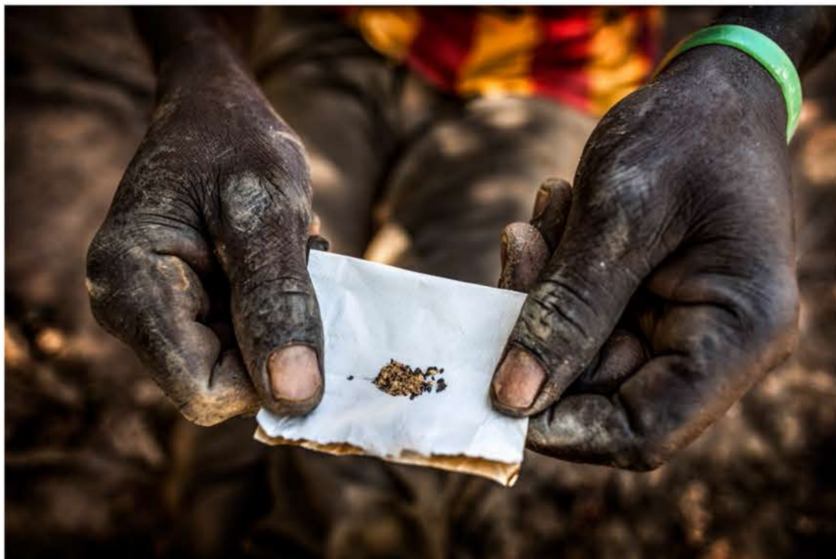
El preciado, valioso y maldito metal dorado en forma de diminutos granitos, momentos antes de ser vendido a un intermediario, en una de las muchas minas de oro artesanales diseminadas por toda la Sabana.