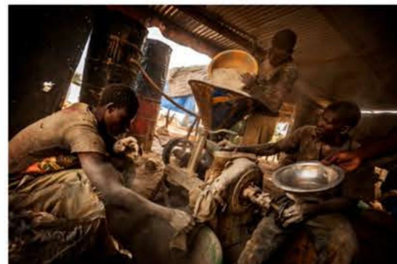
Un grupo de jóvenes muelen tierra que acaban de extraer de las profundidades en busca de polvo de oro.