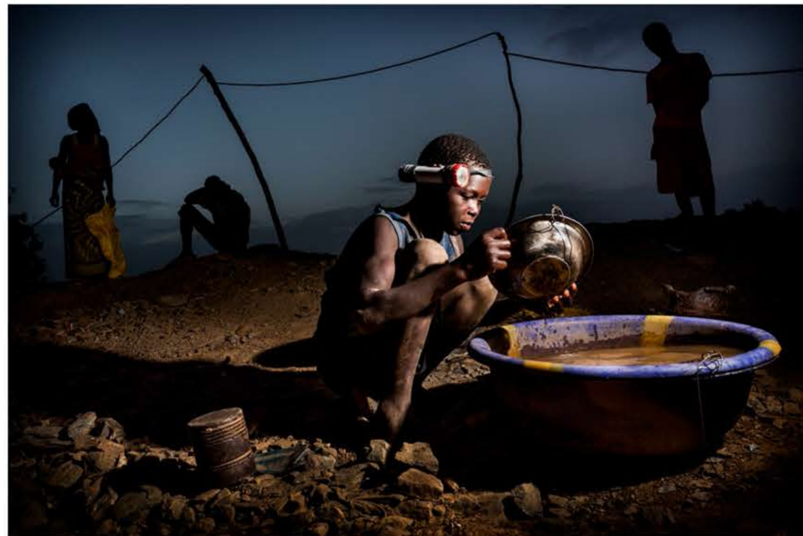
Un niño lava con su batea durante la noche la tierra extraída de las profundidades de su agujero en la mina de oro artesanal de Mankarga V3, en busca de escurridizos granitos de oro, que posteriormente venderá al intermediario local, para conseguir dinero con los que ayudar a alimentar a su familia.