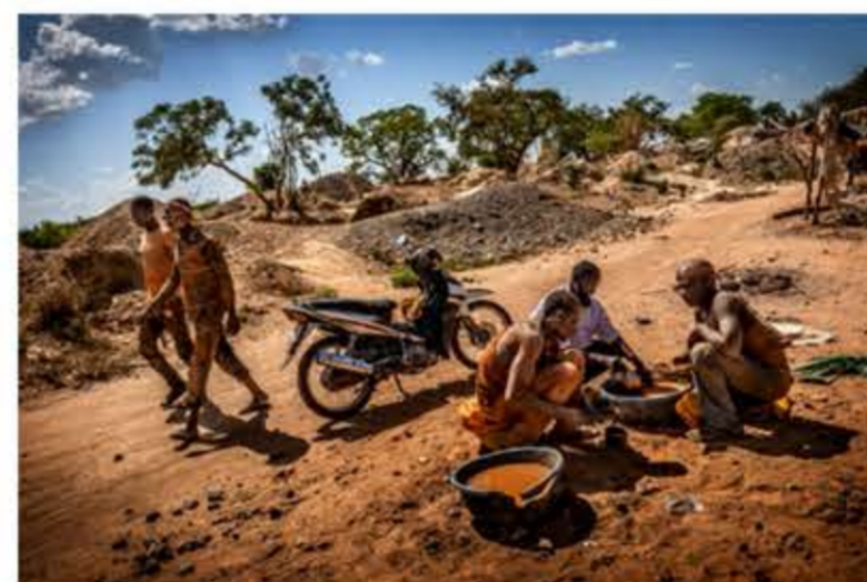
Un grupo de jóvenes lava la tierra extraída de las profundidades en busca de oro, en la mina artesanal de Yaika.