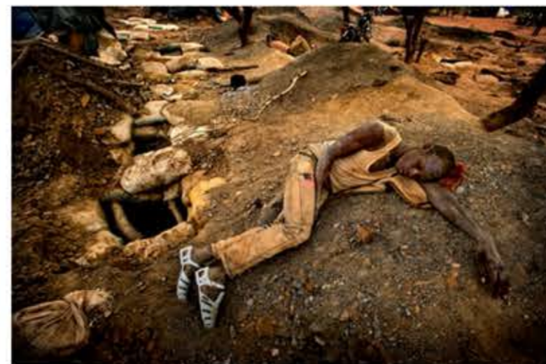
Un joven duerme junto a la entrada del "hoyo" que él mismo ha perforado. Esta es la práctica habitual diaria para los jóvenes trabajadores de estas minas de oro artesanales, para evitar que otra persona se apodere de su agujero y su posible oro enterrado en él.