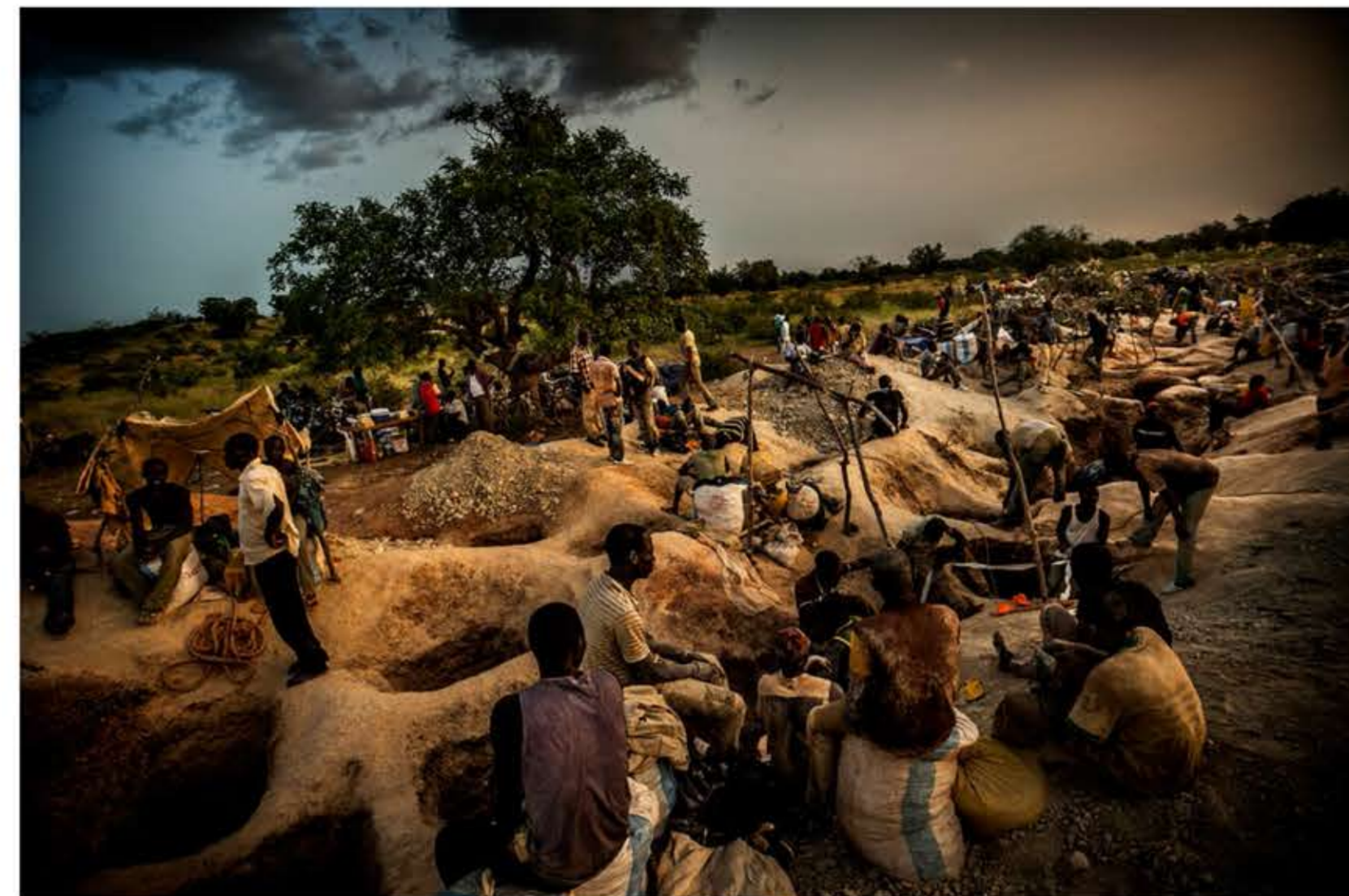
Cientos de personas, en su mayoría niños y jóvenes, trabajan en la mina de oro artesanal de Yaika.