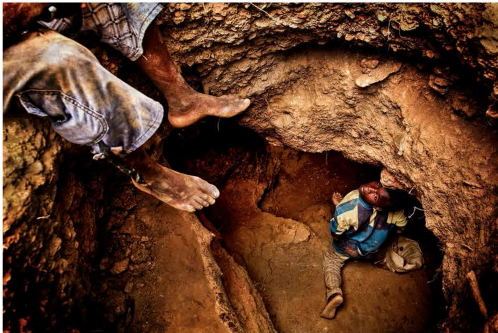
Dos jóvenes entran a trabajar en uno de los muchos agujeros de la mina de oro artesanal de Mankarga V3.